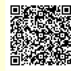
亞聚 CSR 粉絲專頁