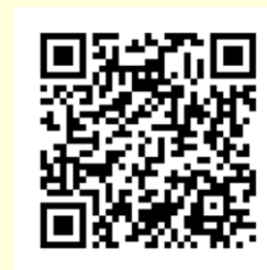
亞聚 CSR 專區