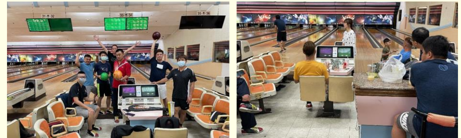
保齡球社 110 年第一季社團活動

在社團活動方面，共成立包括自由車、桌球、釣魚、田園、網球、攝影、壘球、籃球、登山(踏青)、卡拉OK、路跑、保齡球、健行、讀書等 14 個社團，平時由公司與福利委員會共同輔導且贊助經費，員工可在工作之餘，藉由社團活動達到紓解工作壓力、調劑員工身心、增進身體健康的目的。