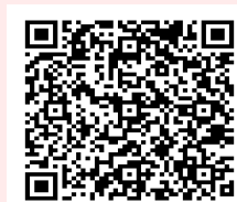
亞聚 ESG 粉絲專頁