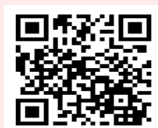
亞聚永續發展專區